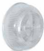
Diffusori in vetro di ricambio per plafoniere tonde