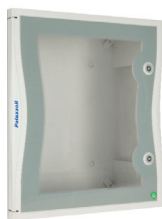
Porta trasparente di ricambio per quadri TAIS CUBE IP66