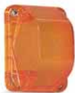
Diffusori di ricambio per lampade spia serie TAIS-MIGNON