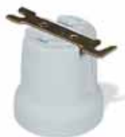
Portalampade E27 di ricambio in porcellana con squadretta per fanali cilindrici serie RINO e fanale UNAV 2137 serie NAVE