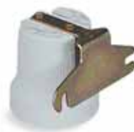
Portalampade E27 di ricambio in porcellana con squadretta per plafoniere ovali e tonde