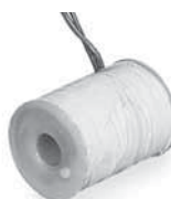
Bobine di ricambio per suonerie ALARM e NAVE