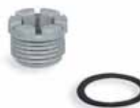
Raccordi di accoppiamento cassetta con foro liscio/ cassetta con foro filettato

Impieghi: servono per accoppiamenti di cassette con passaggi della stessa misura.