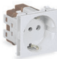
Presse civile schuko standard italiano/tedesco P30

Caratteristiche: alveoli con schermi di protezione. Morsetti posteriori muniti di piastrine serracavo e viti imperdibili.