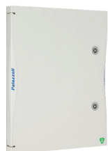
Porta cieca di ricambio per quadri TAIS CUBE IP66