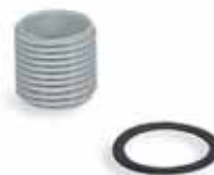
Raccordi di accoppiamento a passo Gas IP67

Impieghi: chiude fori passo Gas non utilizzati.