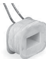
Bobine di ricambio per sirene ALARM e NAVE